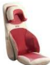
ОТО Back Sniggle