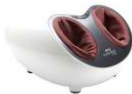
ОТО Adore Foot