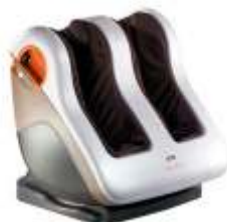
ОТО Activ Foot